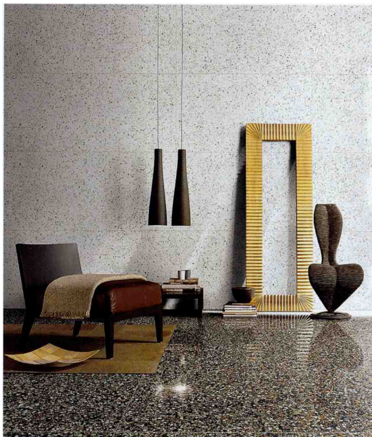
Inspiriert von venezianischen Terrazzoböden: Le Veneziane di Cerim von · by Florim