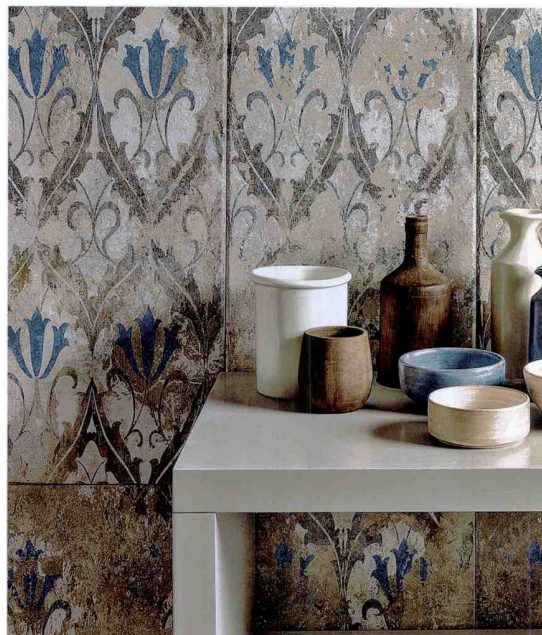
Terrakotta wie aus einer anderen Zeit: IlCotto von · by Tagina