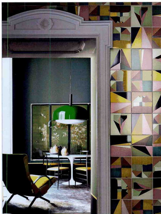
Wie der Blick in ein Kaleidoskop: Corrispondenza von - by Ceramica Bardelli, Design: Dimore Studio