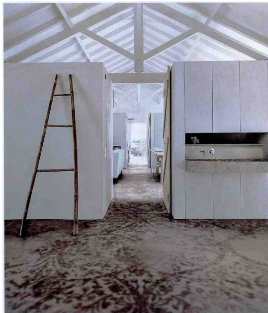
Skalierte Teppichmuster: Grand Carpet von · by Marazzi, Design: Antonio Citterio