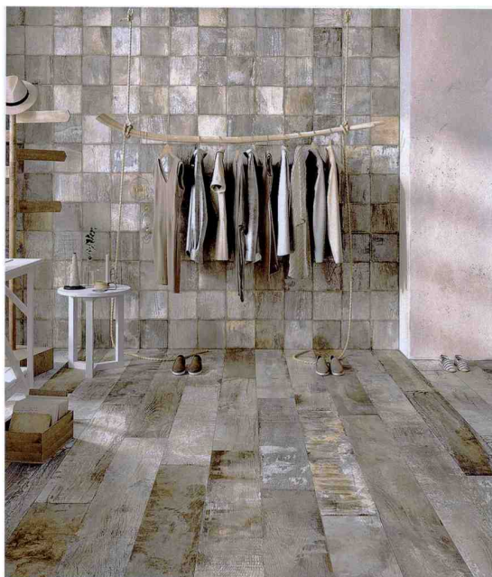
Holzoptik mit Vintage-Charakter: 20Twenty von · by Emilceramica