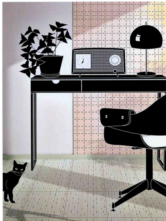
Statt der klassischen Wohnzimmer-Tapete: Confetti von - by Ceramica Vogue, Design: Marcante-Testa