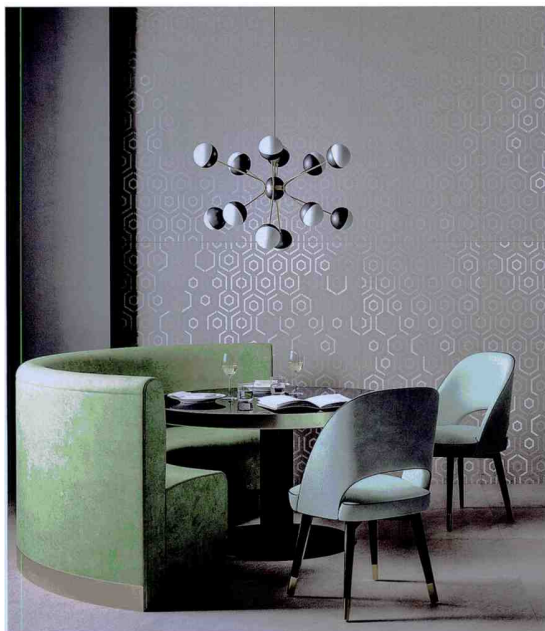
Mit Laser eingraviertes Dekor in Hexagonform: Grecale von · by Ceramiche Refin