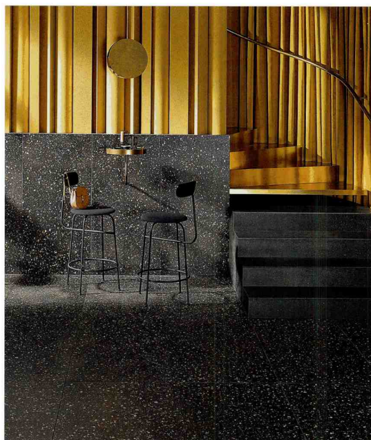
Terrazzo-Nachstellung mit moderner, körniger Optik: Nova von · by Agrob Buchtal