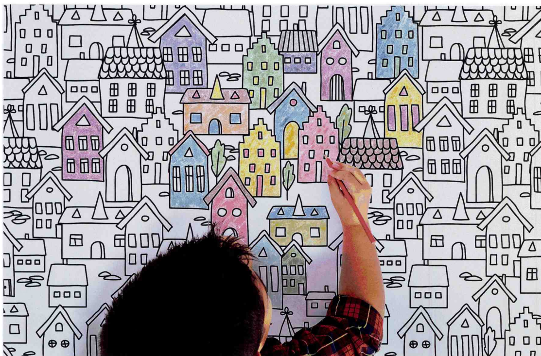
Beschreib- und bemalbare Keramik fürs Kinderzimmer: Paint the House aus der Kollektion Wide & Style - Ceramic Wallpaper von - by ABK

Trends und Neuheiten aus dem Bereich keramischer Wand- und Bodenbeläge von der Bad- und Fliesenmesse in Bologna Trends and new products in the segment of ceramic wall and floor coverings from the bathroom and tile fair in Bologna