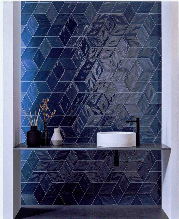
Glasierte, unregelmäßige Oberflächen reflektieren das Licht: Rhombus von • by L'Antic Colonial.