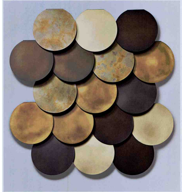
Schuppenpanzer im Messing-Look: CircleWall von · by de Castelli, Design: R&D De Castelli