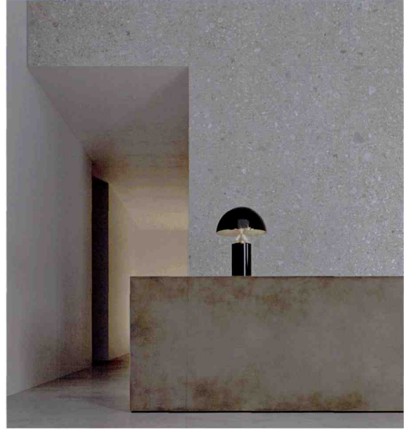
Kommt groß raus mit 162 auf 324 Zentimeter: Grände Stone Look von • by Marazzi