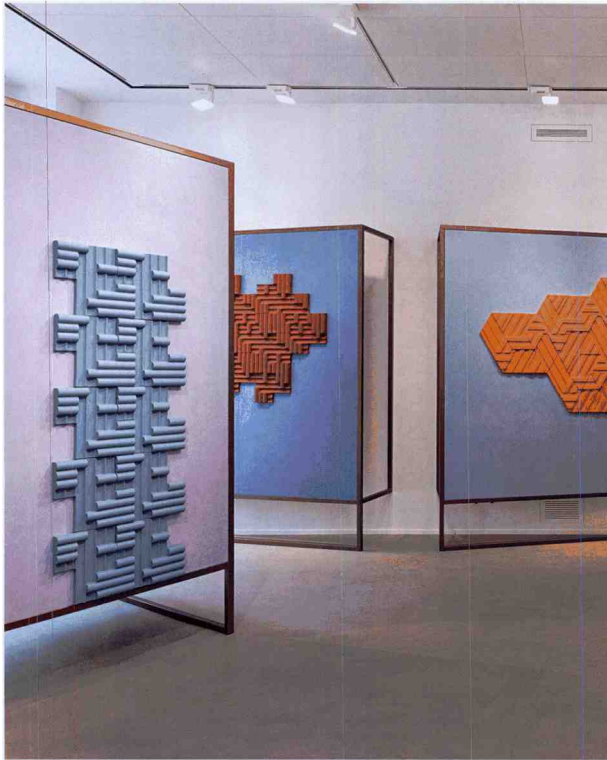
Modulare Repetition von 3-D-Elementen: Rilievi von • by Cedit, Design: Zaven - Enrica Cavarzan & Marco Zavag