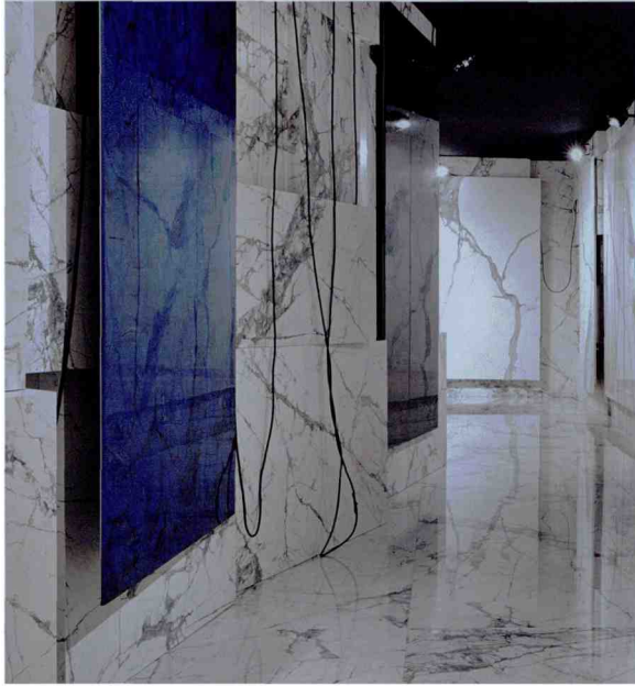
Wie ein Marmorsteinbruch: Messestand mit XXL-Feinsteinzeug | Naturali von • by Laminam