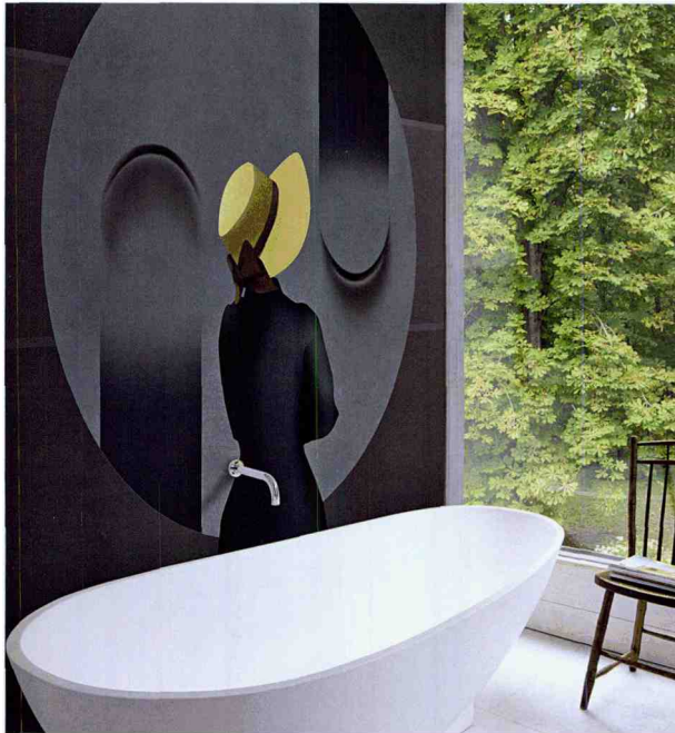
6. Edition der wasserresistenten Wandbekleidung Wet system, hier Dekor No Charlie, von · by Wall & decò