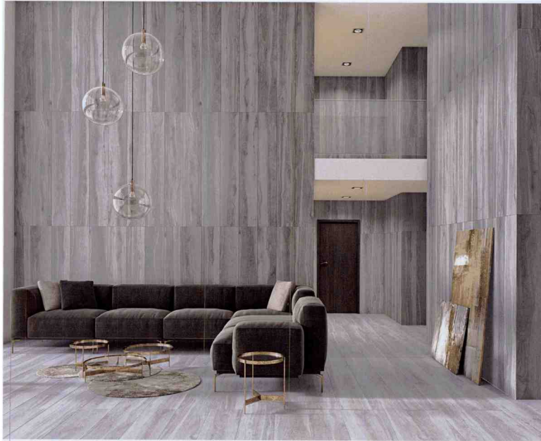
Von Walnussholz inspirierte, dielenartige Formate auch für die Wand: Origin Legno Gray und Silver aus der Insignia Collection von • by Tau