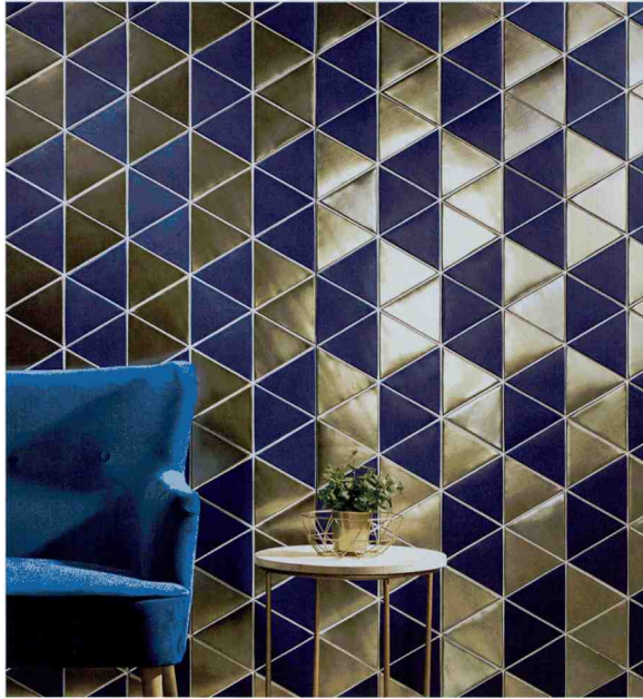
Freie Kombinatorik: Figures Triangle in Blue und Oro von · by Natucer