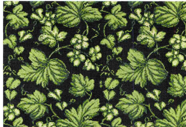
Hommage an Frankreichs Gärten und Schlösser: Château von · by Bisazza, Design: Carlo del Bianco

Large-area wall coverings appear like expressive paintings that can have a significant impact on rooms - including bathrooms and wellness areas. Either in the form of technical, waterproof fabrics or images made of small tesserae.