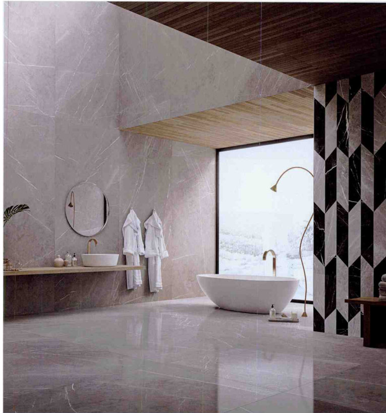
Klassische Naturstein-Eleganz, zeitgemäß-modern mit Feinsteinzeug interpretiert: Prestigio von • by Ceramiche Refin